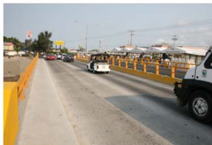
Con el puente Insurgentes

Como primera acción, ampliamos el puente Insurgentes cuya inversión fue de alrededor de 10.5 millones de pesos, con participación del municipio y el Estado.