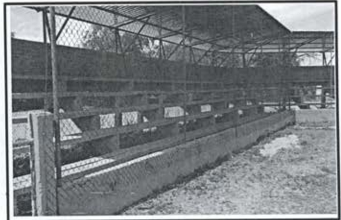
3.- Techumbre metalica Estadio de Beisbol Comunidad Siqueros.