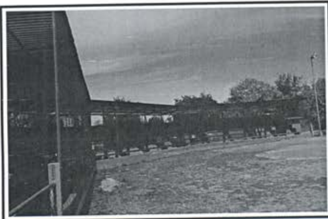
4.- Techumbre metalica Estadio de Beisbol Comunidad Siqueros.