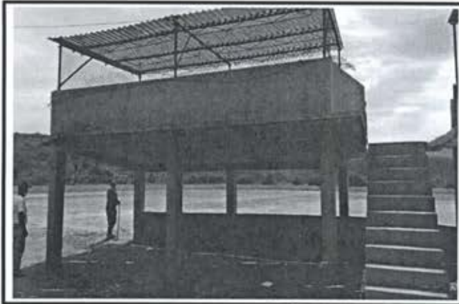
6.- Techumbre metalica Estadio de Beisbol Comunidad Siqueros.