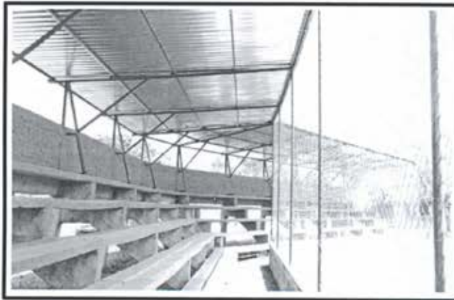
8.- Techumbre metalica Estadio de Beisbol Comunidad Siqueros.