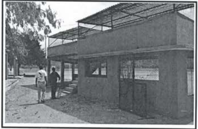
7.- Techumbre metalica Estadio de Beisbol