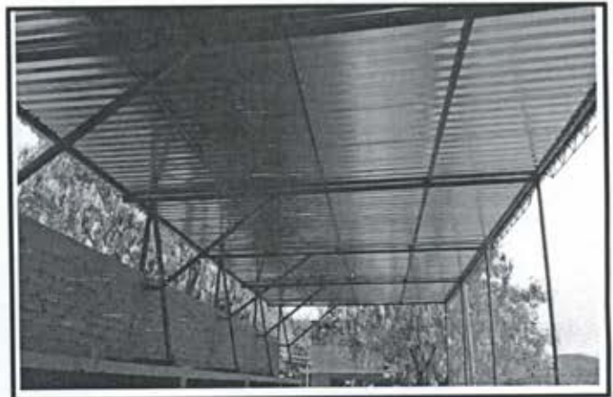
5.- Techumbre metalica Estadio de Beisbol Comunidad Siqueros.