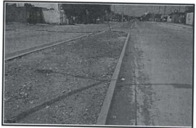
7.- Pavimentacion Avenida del Sol.