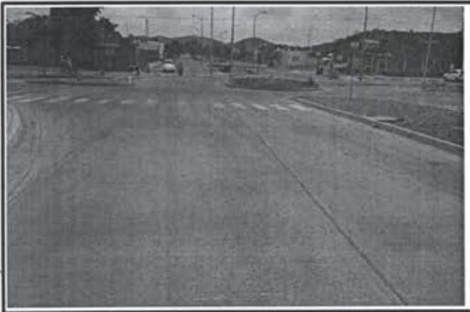
2.- Pavimentacion Avenida del Sol.