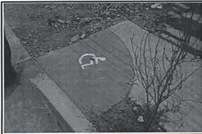
12.- Pavimentacion Avenida del Sol.