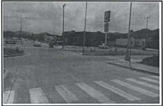
3.- Pavimentacion Avenida del Sol.