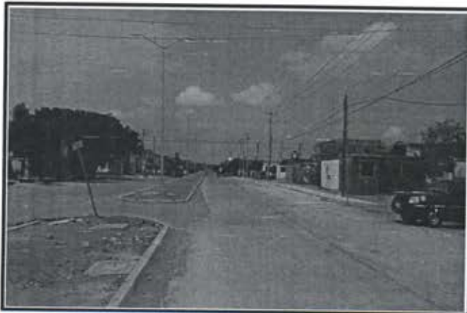
8.- Pavimentacion Avenida del Sol.