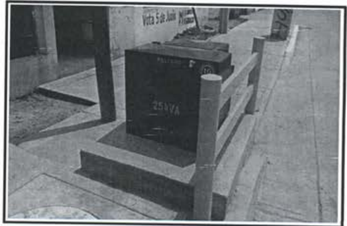
9.- Pavimentacion Avenida del Sol.