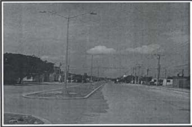
10.- Pavimentacion Avenida del Sol.