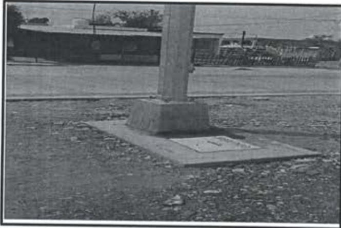
6.- Pavimentacion Avenida del Sol.