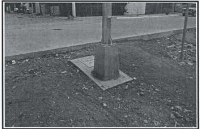
11.- Pavimentacion Avenida del Sol.