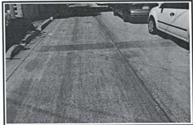
7.- Pavimento de concreto premezclado f'c = 250