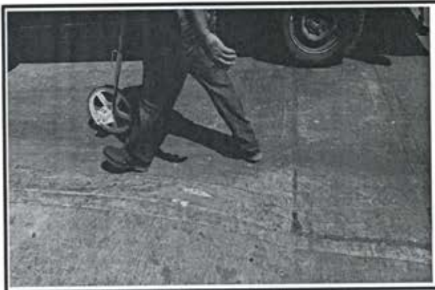
8.- Medicion del pavimento en callejon Hidalgo.