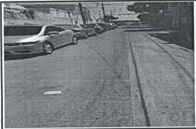
2.- Pavimento de concreto premezclado f'c = 250 kg/cm 2 .