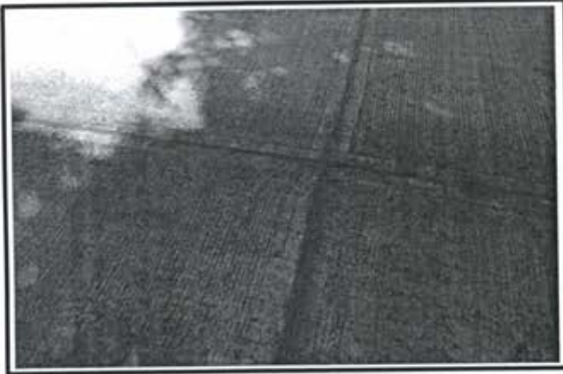
6.- Junta constructiva en pavimento.