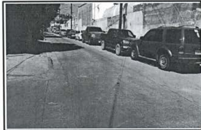
3.- Pavimento de concreto premezclado f'c = 250 kg/cm 2 .