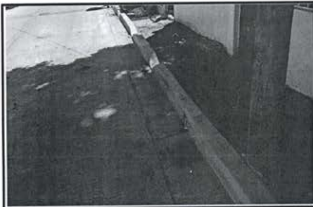
4.- Guarnicion Tipo L de 15x30x60 de concreto Premezclado f'c = 200 kg/cm 2 .