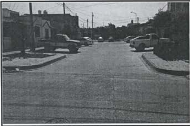
2.- Pavimentacion Calle Privada Huayacan Fraccionamiento Arboledas II.