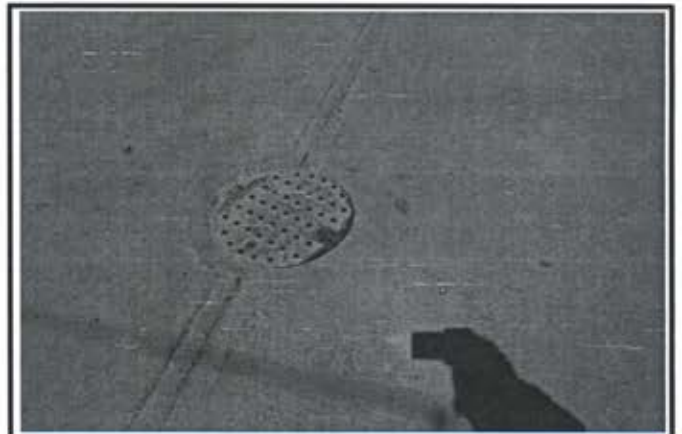
9.- Pavimentacion Calle Privada Huayacan Fraccionamiento Arboledas II.