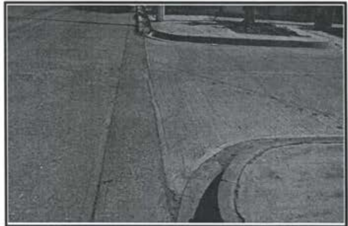
3.- Pavimentacion Calle Privada Huayacan Fraccionamiento Arboledas II.