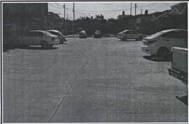
4.- Pavimentacion Calle Privada Huayacan Fraccionamiento Arboledas II.