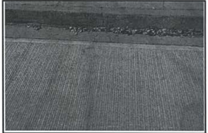
7.- Pavimentacion Calle Privada Huayacan