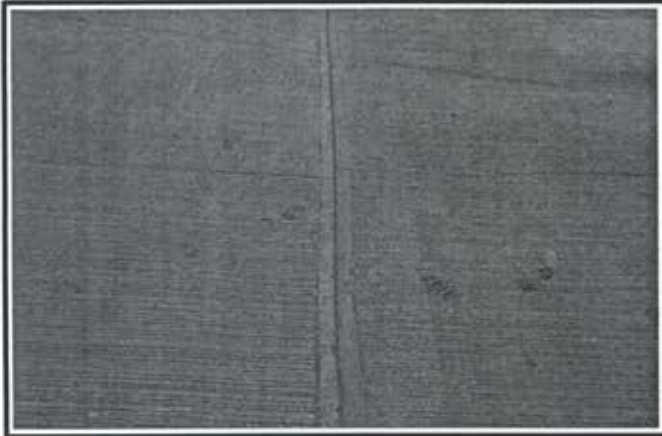
6.- Pavimentacion Calle Privada Huayacan Fraccionamiento Arboledas II.