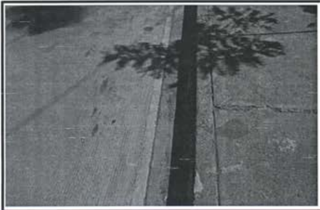
8.- Pavimentacion Calle Privada Huayacan Fraccionamiento Arboledas II.