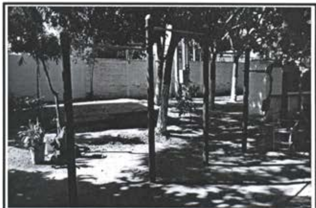
9.- Juego de barras.