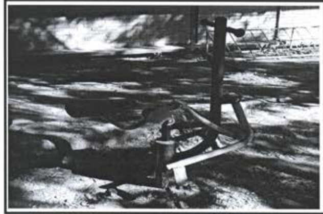
3.- Equipo Horse Rider.