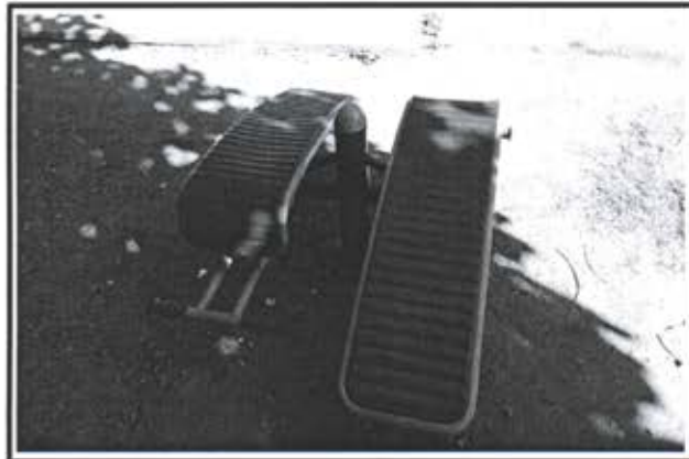
8.- Ejercitador Abdominal