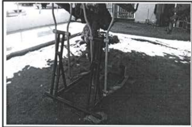
7.- Equipo Eliptico Doble