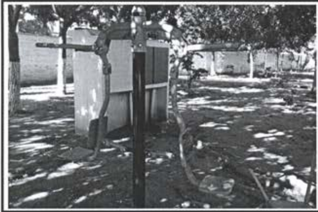
6.- Equipo Pull- Down