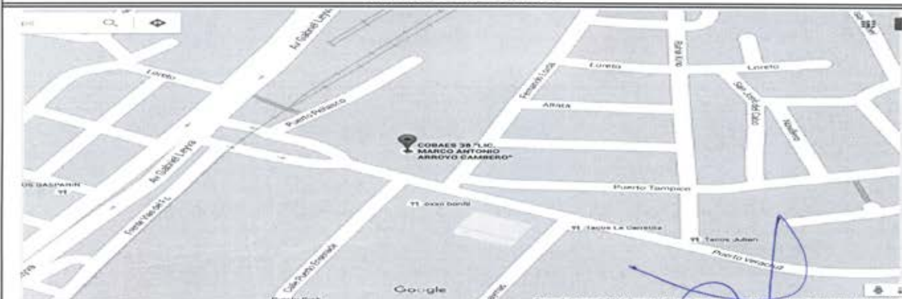
1.- Microlocalización de Escuela Cobaes No .38 Marco Antonio Arrollo Cambero, Colonia Casa Redonda.