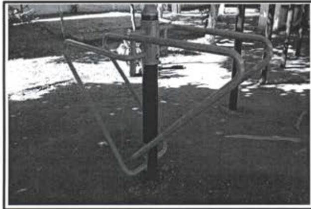
4.- Juego de Barras Paralelas.