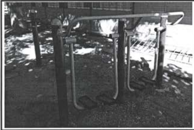
2.- Caminadora (Double Helt Walker).