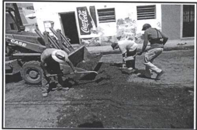
11.- Retiro de base en tramo a pavimentar , por no cumplir con la compactacion adecuada.