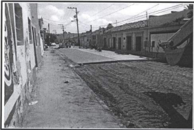
12.- Colocacion de Base para pavimento de 20 cm.