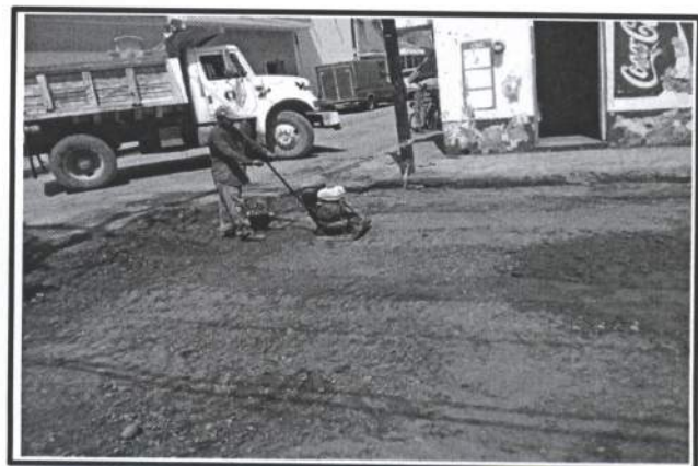
9.- Colocacion y compactacione base para pavimento de 20 cm.