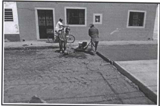
7.- Colocacion de Base para pavimento de 20 cm.