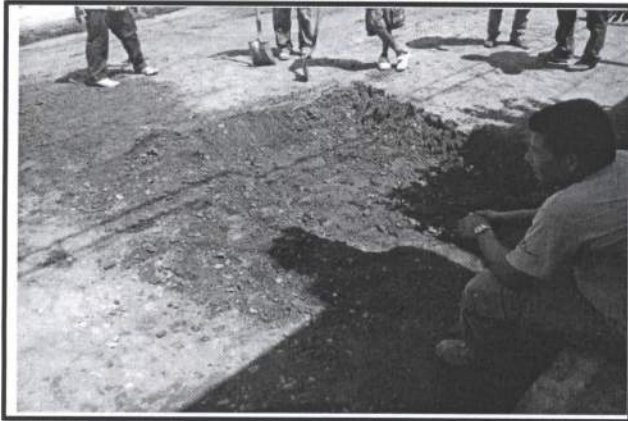
10.- Retiro de base en tramo a pavimentar , por no cumplir con la compactacion adecuada.