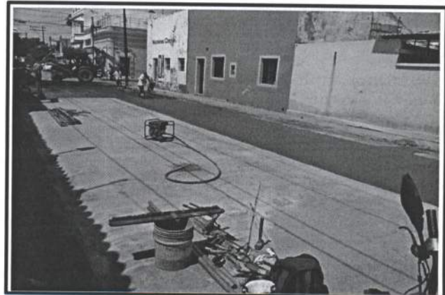
5.- Reposicion de pavimento de concreto Premezclado Especial a 24 Horas Hidraulico de 20 cm de espesor.