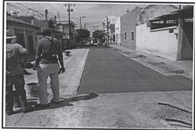
3.- Reposicion de pavimento de concreto Premezclado Especial a 24 Horas Hidraulico de 20 cm de espesor.