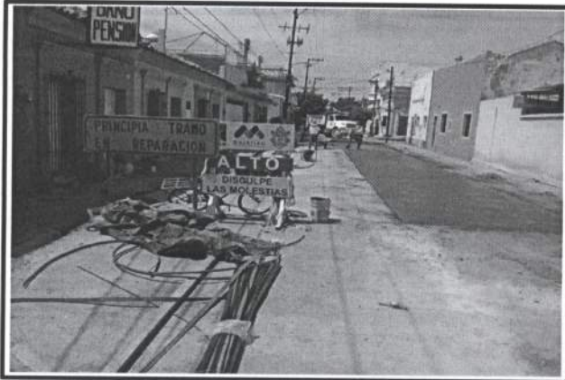
2.- Reposicion de pavimento de concreto Premezclado Especial a 24 Horas Hidraulico de 20 cm de espesor.