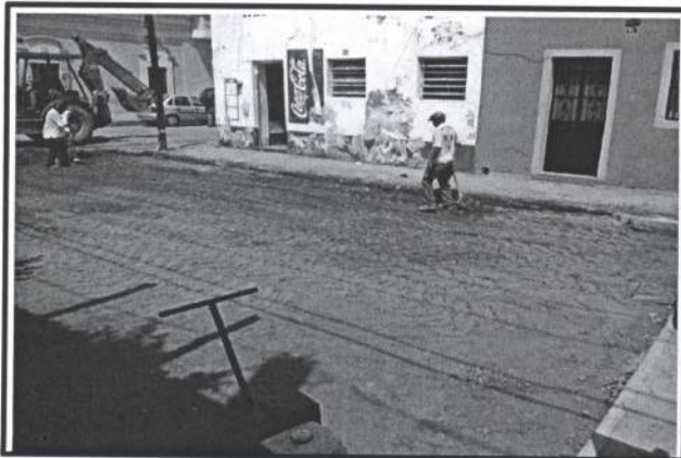
8.- Colocacion y Compactacion de base para pavimento de 20 cm.