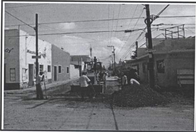
6.- Colocacion de Base para pavimento de 20 cm.