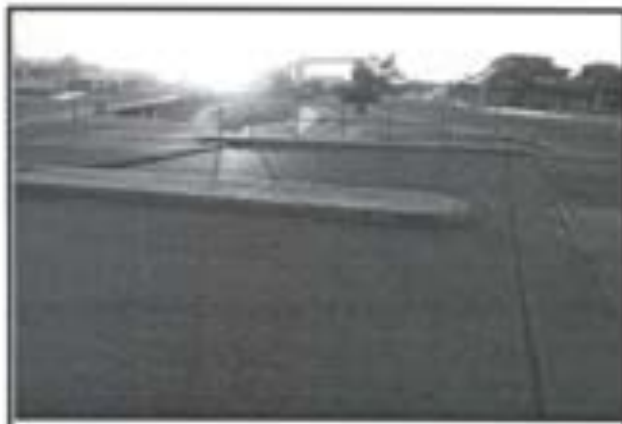
19.- Pavimento de concreto Premezclado FC 250 KG/CM2.