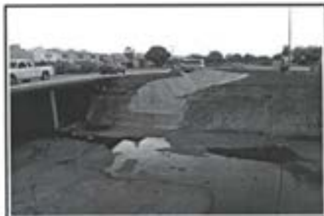
5.- Losa de Concreto en Canal, Conexión al viejo canal.