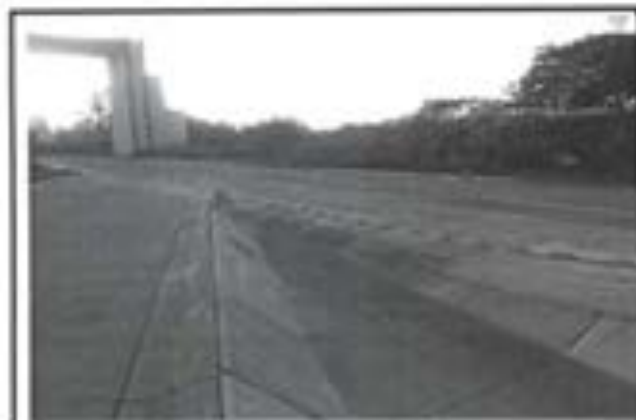
16.- Losa de Concreto en Canal.