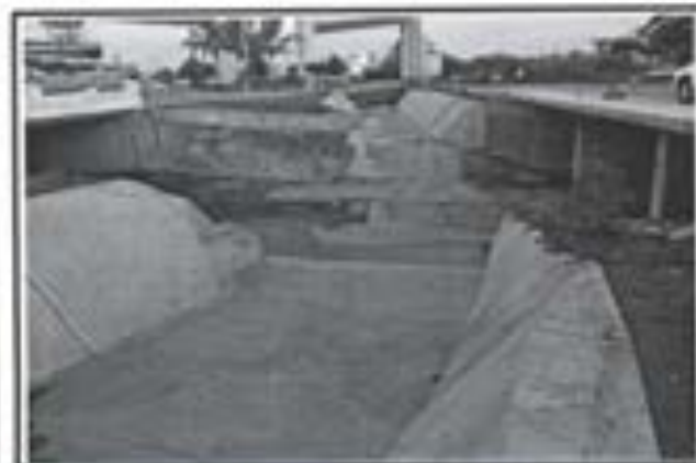
4.- Losa de Concreto en Canal, Conexión al viejo canal.