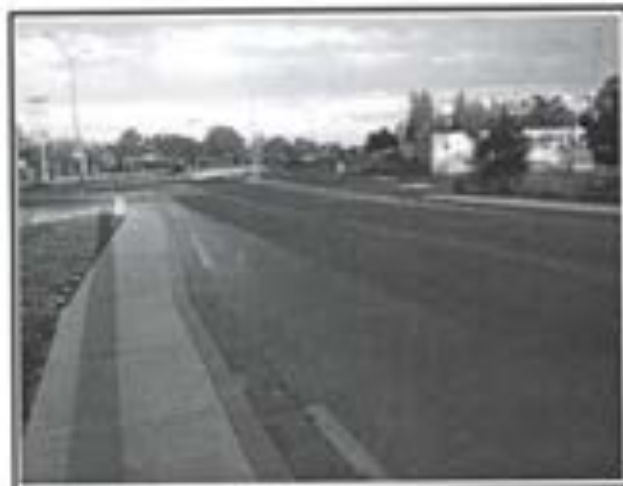
24.- Pavimento de concreto Premezclado FC 250 KG/CM2.