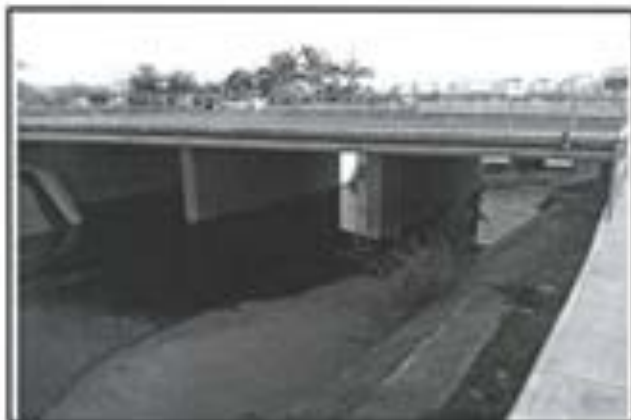
9.- Muros de Concreto armados colocados en losa puente.