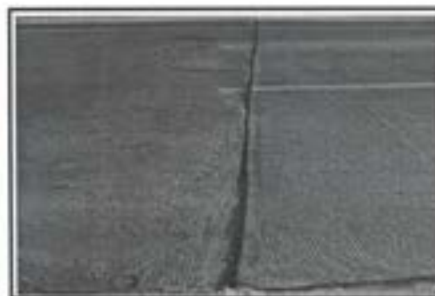
13.- Losa de Concreto FC 250 KG/CM2.