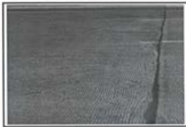
11.- Losa de Concreto FC 250 KG/CM2.