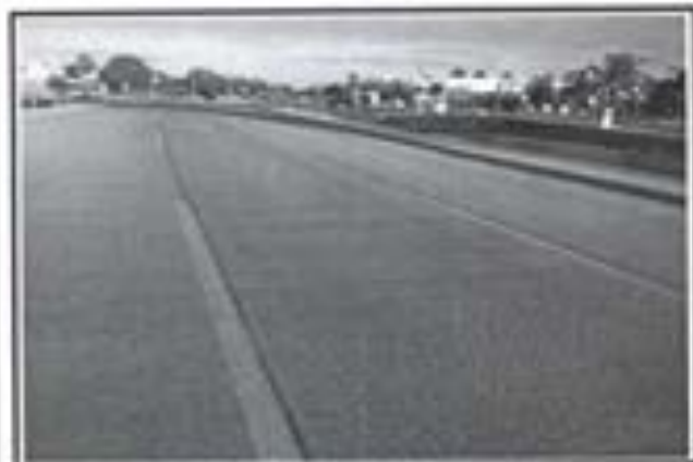
2.- Pavimento de concreto Premezclado FC 250 KG/CM2.