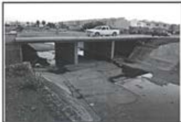
6.- Muros de Concreto armados colocados en losa puente.