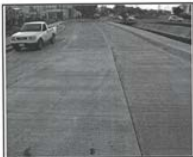
22.- Pavimento de concreto Premezclado FC 250 KG/CM2.