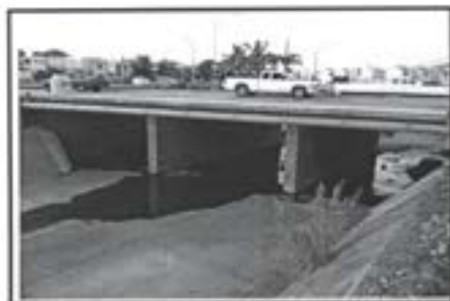
12.- Muros de Concreto armados colocados en losa puente.