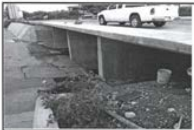
7.- Muros de Concreto armados colocados en