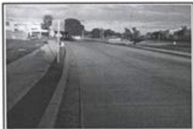
3.- Pavimento de concreto Premezclado FC 250 KG/CM2.