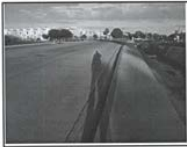
25.- Pavimento de concreto Premezclado FC 250 KG/CM2.