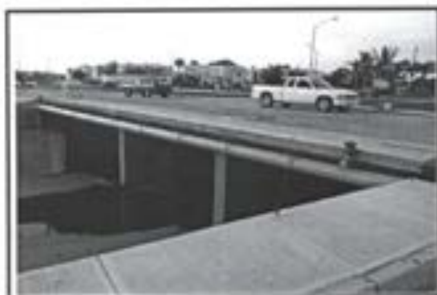
10.- Muros de Concreto armados colocados en losa puente.