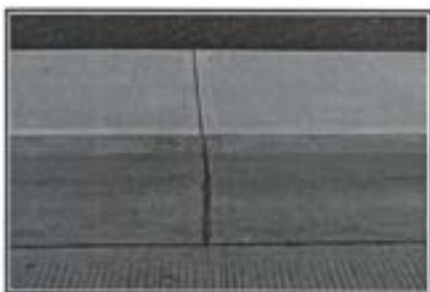
21.- Guarnición Tipo I DE 15X20X20 y Califateo de Losas.