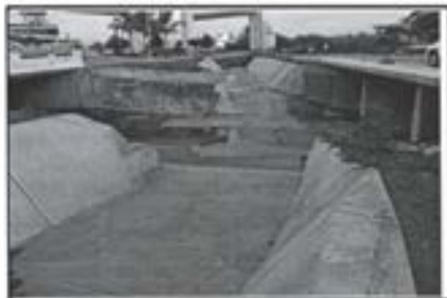
15.- Losa de Concreto en Canal.