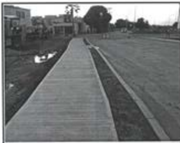
23.- Banqueta de concreto premezclado FC 200 KG/CM2 DE 10 cms de espesor.