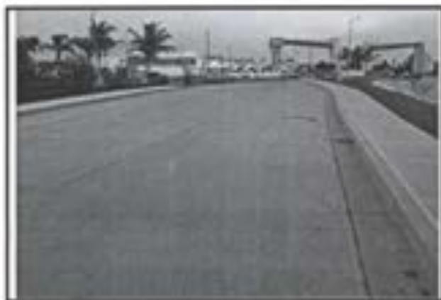
18.- Pavimento de concreto Premezclado FC 250 KG/CM2.