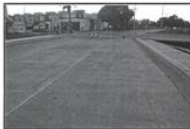
20.- Pavimento de concreto Premezclado FC 250 KG/CM2.