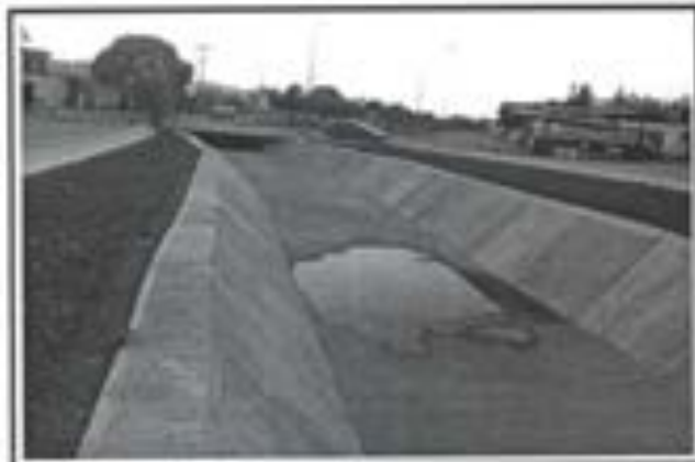
14.- Losa de Concreto en Canal.