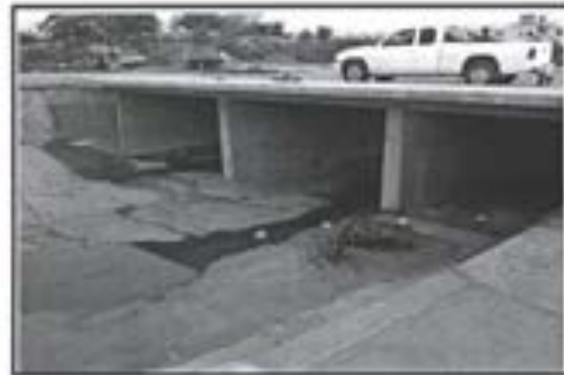
8.- Muros de Concreto armados colocados en losa puente.