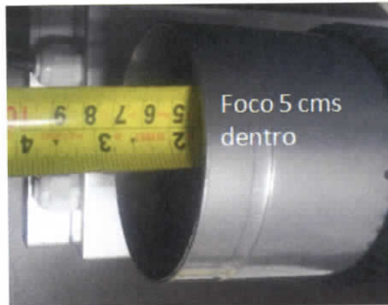
Azteca Lighting, SA de CV

Por lo que una vez analizada las propuestas técnicas, se elabora el cuadro que contienen las ofertas económicas presentadas por los participantes: