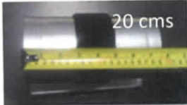
Azteca Lighting, SA de CV